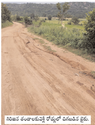
గిరిజన తండాలకు వెళ్లే రోడ్డులో దిగబడిన బైక్.

వాహనదారులు అంగ వైకల్యానికి గురవుతున్నారు. మండల పరిధిలోని అసంతసాగర్, చెరుపుముందలి తండా, బిందెం గడ్డతండా, బేకులతండా, రోకటిగుట్టతండా, బండమీది తండా, కొన్ని తాండాలను గ్రామపంచాయతీలుగా ఏర్పాటు చేశారు. కానీ దేవుడు వరమిచ్చిన పూజారి కరుణించలేదన్న చందంగా ప్రభుత్వాలు మారినా ప్రజా సమస్యలను పరిష్కరించడంలేదని వారు వాపోతున్నారు. వర్షాకాలంలో రాకపోకలకు ఇబ్బందులుపడుతున్న ప్రజలను