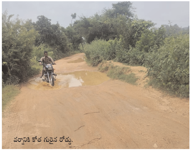
వర్షానికి కోత గురైన రోడ్డు.

సమస్యలు పరిష్కరించాలనే విన్నవించినప్పటికీ ప్రజా ప్రతినిధులుగాని, అధికారులుగాని పట్టించుకోవడం లేదని గ్రామాలలోని ప్రజలు ఆరోపిస్తున్నారు. మండల కేంద్రం నుంచి గ్రామాలకు వెళ్లి మట్టి రోడ్లు వర్షాకాలంలో కోతకు గురై పూర్తిగా గుంతలమయంగా మారుతుంది. అస్పత్రులకు వెళ్లాలన్నగాని రోడ్డునొకర్యం లేకపోవడంతో ప్రజలు ఇబ్బందులు ఎదుర్కొంటున్నారు. ఇప్పటికైనా అధికారులు ప్రజాప్రతినిధులు స్పందించి మట్టి రోడ్లను బీటీ రోడ్లుగా మార్చాలని గ్రామీణ ప్రాంత ప్రజలు కోరుతున్నారు.