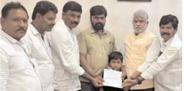
సిఎం రిలీఫ్ ఫండ్ చెక్కును అందిస్తున్న దృశ్యం