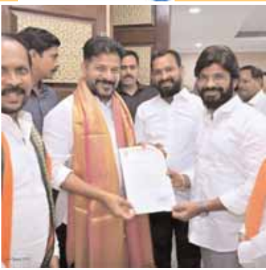
బాలాపూర్ గణేష్ ఉత్సవాల్లో పాల్గొనగలరని ముఖ్యమంత్రికి ఆహ్వానం.

బాలాపూర్ గణేష్ ఉత్సవ సమితి బాలాపూర్ మేజర్ స్ట్రాస్ (ఆగస్టు 31): తెలంగాణ రాష్ట్ర ముఖ్యమంత్రి ఎస్.ఎం. కేశవ్ రెడ్డి గణేష్ ఉత్సవాల సందర్భంగా నిర్వహించినటువంటి సన్మాన కార్యక్రమంలో పాల్గొనాలని బాలాపూర్ గణేష్ ఉత్సవ సమితి ముఖ్యమంత్రికి రెడ్డికి విజ్ఞప్తి చేశారు. ఎటువంటి సమస్యలు తలెత్తకుండా బాలాపూర్ గ్రామంలోకి వచ్చే విధంగా రహదారుల