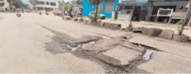
కమ్యూనిటీ హెల్త్ సెంటర్ సమీపంలో ఉన్న గుంతల రోడ్డు గుంతల మయంగా ఉన్న రోడ్డు

● నిఘా లోపం ప్రయాణీకులకు శాపం ● వాహన చోధకుల అవస్థలు వర్షనాతీతం ● గుంతల మయంగా ఉన్న రోడ్డుకు మరమ్మత్తులకు నోచుకోని వైనం