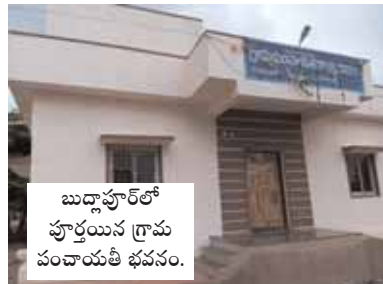
బుద్ధాపూర్ లో పూర్తయిన గ్రామ పంచాయతీ భవనం.

ఊడ పల్లి ప్రాథమికోన్నత పాఠశాలలో మన ఊరు మనబడి కింద చేపట్టిన స్కూల్ బిల్డింగ్. దోమ, మేజర్ న్యూస్ (ఆగస్టు 31): అప్పులు తెచ్చి పనులు చేశాం.. వడ్డీ కట్టలేక భారంగా మారుతుంది.. ఇస్తామని చెప్పిన చేశాం... అధికారుల యొక్క ఆదేశాల మేరకు పనులు పూర్తి చేయాలని సూచించడంతో బిల్లులు కూడా త్వరగా చెల్లిస్తామని చెప్పడంతో కాంట్రాక్టర్లు ఈ పనుల కోసం అప్పులు తెచ్చి నిర్మాణాలు కొనసాగించామని, లక్షల రూపాయలు అప్పుగా తెచ్చి నిర్మాణాలు చేపట్టి నెలలు గడుస్తున్న ఇప్పటివరకు ఎటువంటి బిల్లులు చెల్లించకపోవడంతో తెచ్చిన అప్పులకు వడ్డీలు కట్టలేక ఇబ్బందులు పడుతున్నామని దోమ మండల పరిధిలోని పలు గ్రామాల్లో పనులు చేపట్టిన కాంట్రాక్టర్లు ఆవేదన వ్యక్తం చేస్తున్నారు. బిల్లులు చెల్లించకపోతే తమకు ఆత్మహత్యలే శరణ్యమని కావున ప్రభుత్వం స్పందించి తమకు బిల్లులు చెల్లించేలా చూడాలని పలువురు కాంట్రాక్టర్లు కోరుతున్నారు.