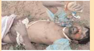
అనుమానాస్పద స్థితిలో మృతి చెందిన వ్యక్తి

పెద్దేముల్, మేజర్ న్యూస్ (ఆగస్టు 31): పెద్దేముల్ మండల పరిధిలోని రుద్రారం గ్రామంలో రుమాధాపశత్తు ఓ వ్యక్తి మృతి చెందాడు. పోలీసులు తెలిపిన వివరాల ప్రకారం.... తేదీ 31.08.2024 నాడు రుద్రారం