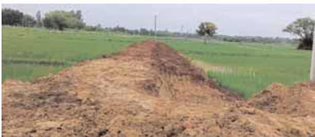
రోడ్డును తొలగించిన దృశ్యం.