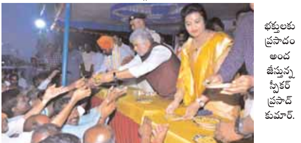
భక్తులకు ప్రసాదం అందజేస్తున్న స్పీకర్ ప్రసాద్ కుమార్.