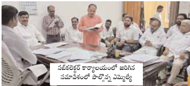
సబ్ కలెక్టర్ కార్యాలయంలో జరిగిన సమావేశంలో పాల్గొన్న ఎమ్మెల్యే