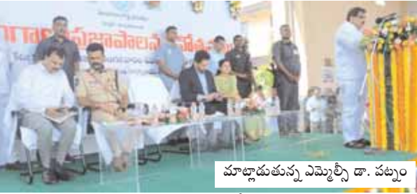
మాట్లాడుతున్న ఎమ్మెల్యే డా. పట్నం

అ లో అ ్తొ ని తిరుగుతున్నారన్నారు. ప్రభుత్వం ప్రవేశ పెట్టిన "మహాలక్ష్మి" పథకం ద్వారా ఇచ్చిన గ్యారంటీ లతో రాష్ట్రమంతటా బాలికలు, మహిళలు, ట్రాన్స్ జెండర్లకు ఉచిత బస్సు సౌకర్యం, "మహాలక్ష్మి" వంట గ్యాస్ సబ్సిడీ పథకం ద్వారా మన జిల్లాలో 500 రూపాయలకే అర్జులైన 74వేల 457 మంది లబ్ధిదారులకు నేటి వరకు ఒక లక్ష 72 వేల 393 గ్యాస్ సిలిండర్లను, గృహజ్యోతితో పేదల ఇంట వెలుగులు ఆడబిడ్డ కన్నీళ్లు తుడవాలన్న లక్ష్యంతో మహాలక్ష్మి పథకం కింద మహిళలకు ప్రతి నెల 200 యూనిట్ల వరకు ఉచిత విద్యుత్తు సరఫరాల ద్వారా లబ్ధింతున్నారన్నారు. వైద్యం అందక ఏటకృతి ప్రాణాలు పోకూడదనే ఆశయంతో కొత్తగా 163రకాల చికిత్సలను చేరుస్తు మొత్తం 1835 రకాల చికిత్సలు, 5 లక్షల నుండి 10 లక్షల రూపాయల వరకు "రాజీవ్ ఆరోగ్య శ్రీ" పథకం ద్వారా సత్వర ఉచిత వైద్యం అందించడమే కాకుండా, రాష్ట్రీయ బాల స్వస్థ కార్యక్రమం క్రింద పాఠశాల విద్యార్థులకు చేసే వైద్య పరీక్షల్లో రాష్ట్రంలోనే మన జిల్లా మొదటి స్థానంలో ఉందన్నారు. నాణ్యమైన విద్యతోపాటు విజ్ఞాన, నైపుణ్య, సామర్థ్యాలను పెంచుతూ విద్యార్థులను తీర్చిదిద్ది భవిష్యత్ తరాలకు ఆదర్శవంతమైన పౌరులను సమాజానికి అందించడానికై రాష్ట్ర ప్రభుత్వం అమ్మ ఆదర్శ పాఠశాలలను రూపకల్పన చేసి వారికి