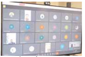
జామ్ మీడింగ్లో పాల్గొన్న అధికారులు.