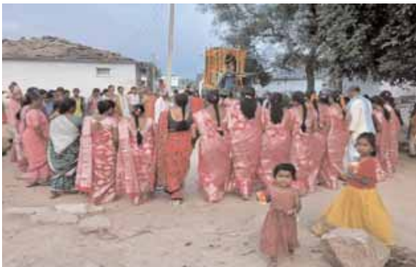
మెట్లకుంటలో వినాయక నిమజ్జనంలో మహిళల కోలాటం