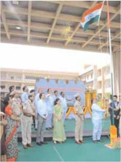
జాతీయ జెండాను ఆవిష్కరిస్తున్న ఎమ్మెల్యే.