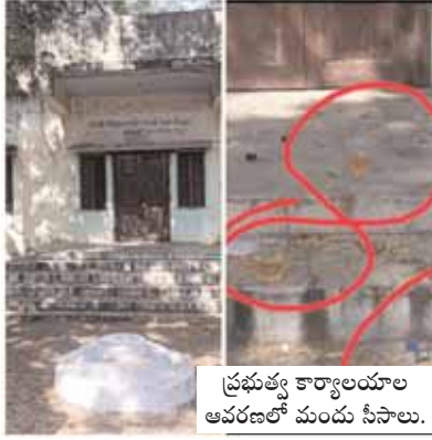
ప్రభుత్వ కార్యాలయాలు ఆవరణలో మందు సీసాలు.

బహిరాబాద్, మేజర్ న్యూస్ (సెప్టెంబర్ 17): బహిరాబాద్ మండల కేంద్రంలోని ప్రభుత్వ బాలికల, బాలురు ఉన్నత పాఠశాలలతో పాటు ప్రభుత్వ శ్రీ శక్తి ఉపాధి హామీ భవనము మందు బాబులకు అడ్డగా మారాయి. అడ్డదిడ్డంగా మద్యం మత్తులో తాగిన సీసాలు పగలగొట్టి తాగిన సీసాలు వదిలేసి అసాంఘిక కార్యక్రమాలు చేస్తున్నారని స్థానికులు ఆరోపిస్తున్నారు. ప్రభుత్వ కార్యాలయంలో ప్రతిరోజూ సీసాలు తాగి పగలగొట్టి తాగిన గ్లాసులు బాటిల్ అక్కడనే వదిలేసి తీరా ఉదయాన్నే పరిసరాలు శుభ్రం చేయడానికి వచ్చిన సిబ్బంది ఇది ఇబ్బంది మారింది. ఇకనైనా పోలీసులు అలాంటి వ్యక్తులపై చర్యలు తీసుకుని అసాంఘిక కార్యకలాపాలు పునరవ్యతం కాకుండా చూడాలని మండల ప్రజలు కోరుతున్నారు. బాలురు ఉన్నత ప్రభుత్వ పాఠశాలలో మైదానంలో మద్యం తాగుతూ తాగిన సీసాలు సైతం పగలగొట్టి అసాంఘిక కార్యకలాపాలు సాగిస్తున్న పట్టించుకునే నాధుడు కరువయ్యారు అని స్థానికులు చర్చించుకుంటున్నారు.