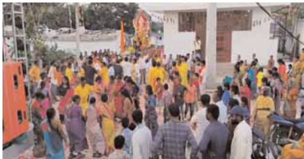
బొంరాస్పేట్లో వినాయకుడిని నిమజ్జనానికి తరలిస్తున్న ఉత్సవ కమిటీ సభ్యులు

బొంరాస్పేట్, మేజర్ న్యూస్ (సెప్టెంబరు 18): వినాయక నిమజ్జన ఉత్సవాల్లో భాగంగా రెండో రోజు బుధవారం బొంరాస్పేట్ మండల కేంద్రంలో వినాయకులను నిమజ్జనానికి తరలించారు. మండల కేంద్రంలో ప్రతిష్ఠించిన వినాయకులతో గ్రామంలోని పురవిధుల మీదుగా శోభయాత్ర నిర్వహించారు. యువకుల డ్యాన్స్లు, ఆటాపాటల నడుమ వినాయకులను పెద్ద చెరువుకు నిమజ్జనానికి తరలించారు.