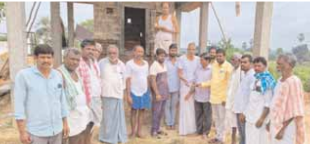
విరాళం మందిస్తున్న స్థానిక నాయకులు