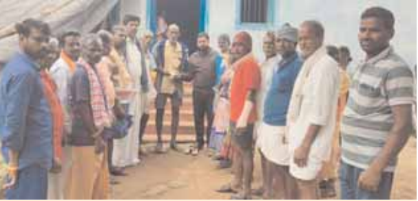
ఆర్థిక సహాయం అందిస్తున్న ముదిరాజ్ సంఘం నాయకులు.