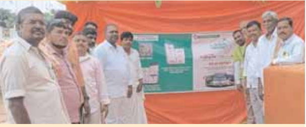
అవగాహన కల్పిస్తున్న నాయకులు.