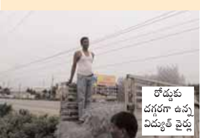
కందుకూరు, మేజర్ న్యూస్ (సెప్టెంబర్ 09): కందుకూరు మండలం కొత్తూర్ వాగు సమీపంలో శ్రీశైలం జాతీయ రహదారి ప్రక్కన టీ టెం సమీపంలో విద్యుత్ వైర్లు ప్రమాదకరంగా ఉన్నాయి. కొత్తూర్ గ్రామ రైవెన్యూ 136 సర్వేసంఖ్య