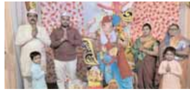
శ్రీరామ కాలనీ, రిలయన్స్ కాలనీలో రాజే మిత్ర మండల్ అసోసియేషన్ ఆధ్వర్యంలో ఏర్పాటుచేసిన గణపయ్యకు పూజలు నిర్వహిస్తున్న భక్తులు.

జల్ పల్లి, మేజర్ న్యూస్ (సెప్టెంబర్ 10): వినాయక నవరాత్రుల సందర్భంగా జల్ పల్లి పురపాలక పరిధి శ్రీరామ కాలనీలో పలు మండలాలలో భక్తులు నాలుగవ రోజు గణపయ్యకు భక్తి శ్రద్ధలతో పూజలు నిర్వహిస్తున్నారు. కాలనీలో ఏర్పాటు చేసిన గణేష్ మండలాల వద్ద వినాయకుడికి ప్రత్యేక పూజలు నిర్వహించడంతోపాటు, అన్నదాన కార్యక్రమాలు చేపడుతున్నారు.