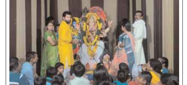
శ్రీరామ కాలనీ 19 వ వార్డులో ఉమ్మడి ఉత్సవ గణేష్ కమిటీ సభ్యుల ఆధ్వర్యంలో ప్రతిష్ఠించిన గణనాధునికి పూజలు నిర్వహిస్తున్న భక్తులు.