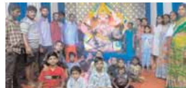
శ్రీ సాయి వినాయక యూత్ అసోసియేషన్ ఆధ్వర్యంలో నెలకోల్పిన వినాయకునికి పూజలు నిర్వహిస్తున్న కమిటీ సభ్యులు, చిన్నారులు.