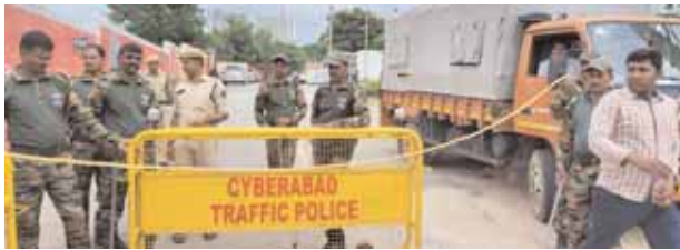
బందోబస్తు చేపట్టిన పోలీసులు

గండిపేట్, మేజర్ న్యూస్ (సెప్టెంబర్ 12): బీఆర్ఎస్ ఎమ్మెల్యే పాడి కౌశిక్ రెడ్డి, ఎమ్మెల్యే అరికెపూడి గాంధీల మధ్య సవాళ్లు, ప్రతి సవాళ్ల మాటల తూటాలుగా పేలుతున్నాయి. ఈ నేపథ్యంలో కౌశిక్ రెడ్డి ఇంటిపై దాడికి పాల్పడిన ఎమ్మెల్యే అరికెపూడి గాంధీ, అతని అనుచరులను పోలీసులు అరెస్ట్ చేసి నార్సింగి పోలీసుస్టేషన్కు తరలించారు. దీంతో ఆయనను పరామర్శించేందుకు ఎమ్మెల్యేలు దానం నాగేందర్, కాలె యాదయ్య, ప్రకాష్ గౌడ్, మాజీ ఎంపీ గడ్డం రంజిత్రెడ్డిలు వచ్చారు. టీఆర్ఎస్ పార్టీ నుంచి కాంగ్రెస్లో చేరిన ఎమ్మెల్యేలు అందరూ అరికెపూడి గాంధీకి మద్దతుగా నిలువడంతో అందరి చూపు ఆ ఎమ్మెల్యేలపైనే ఉంది. అరికెపూడి గాంధీని అరెస్ట్ చేసి నార్సింగి పోలీసుస్టేషన్కు తరలించడంతో ఆ చుట్టుపక్కల ప్రాంతాల్లో ఎలాంటి అవాంఛనీయ సంఘటనలు జరగకుండా పోలీసులు భారీ బందోబస్తును ఏర్పాటు చేశారు.