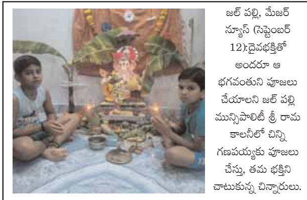
జల్ పల్లి, మేజర్ న్యూస్( సెప్టెంబర్ 12): దైవభక్తితో అందరూ ఆ భగవంతుని పూజలు చేయాలని జల్ పల్లి మున్సిపాలిటీ శ్రీ రామ కాలనీలో బిన్ని గణపయ్యకు పూజలు చేస్తు, తమ భక్తిని చాటుకున్న చిన్నారులు.