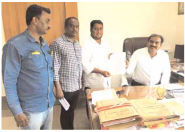
చేవెళ్ల, మేజర్ న్యూస్ ( సెప్టెంబరు 12): నిబంధనలకు విరుద్ధంగా వ్యవహరిస్తున్న పాఠశాల యాజమాన్యంపై చర్యలు తీసుకోవాలని వర్కింగ్ జర్నలిస్టులు

-కలెక్టర్, డీఈవోకు ఫిర్యాదు చేసిన వర్కింగ్ జర్నలిస్టులు