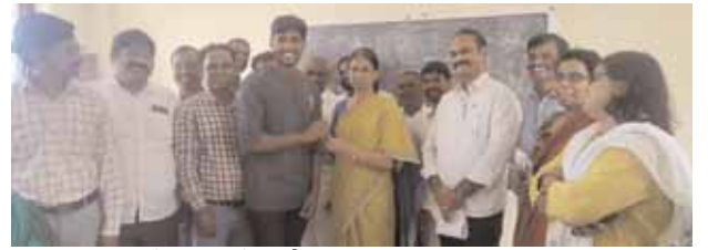
డిగ్రీ వ్రాత పరీక్షలో గెలుపొందిన వారికి బహుమతులు అందజేస్తున్న సబితా ఇంద్రారెడ్డి

సిసి రోడ్డు శంకుస్థాపన చేస్తున్న ఎమ్మెల్యే సబితా ఇంద్రారెడ్డి మహేశ్వరం, మేజర్ న్యూస్ (సెప్టెంబర్ 12): మహేశ్వరం నియోజకవర్గ అభివృద్ధికి కృషి చేస్తామని మాజీ మంత్రి, ఎమ్మెల్యే సబితా ఇంద్రారెడ్డి అన్నారు. గురువారం మహేశ్వరం మండల కేంద్రంలో బొడ్రాయి దగ్గర నుండి పోస్ట్ ఆఫీస్ లైన్, ఉరచెర్ల కట్టవరకు నిర్మిస్తున్న రోడ్డు, మాణిక్యమ్మగూడ లో సిసి రోడ్డు పనులకు 2021-2022 50 లక్షలు ఎంతర్ ఆర్ నిధుల ద్వారా మంజూరైన సిసి రోడ్డు పనులకు మాజీ మంత్రి, ఎమ్మెల్యే సబితా ఇంద్రారెడ్డి శంకుస్థాపన చేశారు. ఈ సందర్భంగా సబితా ఇంద్రారెడ్డి మాట్లాడుతూ.. గత 5 సంవత్సరాలలో పట్టణ ప్రగతి అనే కార్యక్రమం ద్వారా గ్రామాల రూపురేఖలు మార్చారని, గ్రామాలలో త్రాగునీరు ఇబ్బంది లేకుండా మిషన్ భగీరథ, గ్రామాల పరిశుభ్రంగా ఉండడానికి