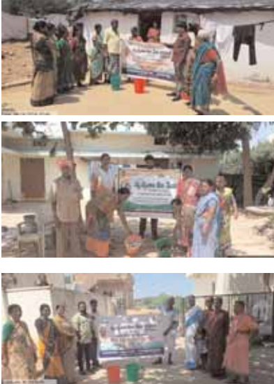
తెలుసుకోవడం కోసం. భారత ప్రభుత్వ చలశక్తి మంత్రిత్వ శాఖ ఆధ్వర్యంలో పనిచేస్తుంది. అని అధికారులు తెలిపారు. మరియు అక్టోబర్ రెండో తేదీ న గ్రామసభల ఏర్పాట్లు, మాతృ గాంధీ జయంతి ఉత్సవాలు, స్వచ్ఛభారత్ దినోత్సవం, సందర్భంగా బహుమతులు పారిశుధ్య సిబ్బందికి, సన్మానం, భీమా పత్రాలు, (పి పి ఈ) కీట్లు అందజేయాలని ప్రభుత్వ నిర్వహించి అధికారులకు ఆదేశించారు.

సెప్టెంబర్ 17 నుండి కార్యక్రమాలు నిర్వహిస్తున్నారు. గురువారం మండల పరిధిలోని తొమ్మిది రేకుల, వేముల్ నర్స, పాటిగడ్డ, కాకునూర్, దత్తాపల్లి, కోనయపల్లి, మంగళ గూడెం, దేవుని గుడి తండా, విడుదలవెల్లి, సంతాపూర్, పోల్వన్ గుట్ట తండా, తదితర గ్రామపంచాయతీలో.. రెవెన్యూ అధికారులు, మండల అభివృద్ధి అధికారులు, అంగన్ వాడీ టీచర్లు, ఎంఎస్ఎం ఆశా వర్కర్లు గ్రామపంచాయతీ సిబ్బంది, ప్రత్యేక అధికారులు, సంబంధిత అధికారులు కార్యక్రమాన్ని నిర్వహించారు. స్వచ్ఛతా హి సేవ (%నూ%) ప్రతి సంవత్సరం సెప్టెంబర్ 15 నుండి అక్టోబర్ 2 వరకు జరుపుకుంటారు. ఇది భారత ప్రభుత్వ జల శక్తి మంత్రిత్వ శాఖ ఆధ్వర్యంలోని తాగునీరు మరియు పారిశుధ్య శాఖ ద్వారా అమలు చేయబడుతుంది. ఇది 15 సెప్టెంబర్ 2018న దేశవ్యాప్తంగా ప్రారంభించబడింది. స్వచ్ఛతా హి సేవను భారత ప్రభుత్వ జలశక్తి మంత్రిత్వ శాఖ ఆధ్వర్యంలో తాగునీరు పారిశుధ్యం విభాగం ప్రారంభించింది. దీని లక్ష్యం.. గ్రామీణ ప్రాంతాలలో వారసత్వ వ్యర్థాలను శుభ్రం చేయడానికి ఘన వ్యర్థాల నిర్వహణ కోసం వివిధ కార్యక్రమాలను నిర్వహించడానికి ప్రజలను సమీకరించడం. మరియు నినాదం “ ఏక్ కదమ్ స్వచ్ఛతకి ఔర్” ఆరోగ్యకరమైన వాతావరణం సౌరీరక శ్రేయస్సు కోసం స్వచ్ఛత ముఖ్యమైనది. ప్రతి ఒక్కరూ మంచి పరిశుభ్రత పారిశుధ్యం