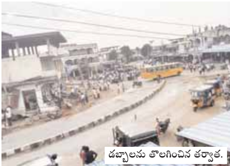
డబ్బాలను తొలగించిన తర్వాత.