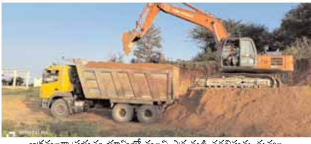
అక్రమంగా ప్రభుత్వ భూమిలో నుంచి ఎర్ర మట్టి తరలిస్తున్న దృశ్యం.

కొట్టుకుంటే గద్దల గుంపుగా వారే అధికారులకు ఏమైంది..? పెద్దేముల్, మేజర్ న్యూస్ (సెప్టెంబర్ 19): పెద్దేముల్ మండల పరిధిలోని కందనెళ్ళి గ్రామంలో సర్వే నెంబర్ 240 లో ఒక ఎకరా ప్రభుత్వ భూమిని, గత ప్రభుత్వ హయాంలో విద్యుత్ సబ్ స్టేషన్ కు కేటాయించారు. కానీ ఆ భూమి గుట్ట ప్రాంతం ఉండడంతో, గుట్టను చదను చేస్తూన్నామని చెప్పి, ఒక ప్రైవేట్ వెంచర్ కు వందల ట్రీపులను తరలిస్తున్నారు. ఒక రైతు తన పొలానికో లేక ఇంటికో, ఒక ట్రాక్టర్ మట్టిని తరలిస్తే గద్దల గుంపులా వారి ట్రాక్టర్ ను సీజ్ చేసి కేసులు పెట్ట రెవెన్యూ మైనింగ్ అధికారులకు ఇంత పెద్ద మొత్తం లో అక్రమంగా ఎలాంటి అనుమతులు లేకుండా ఒకరోజుకు 300 ట్రీపులకు పైగా పెద్ద వాహనాలలో మట్టిని తరలిస్తుంటే అధికారులు ఎం చేస్తున్నారు అని సామాన్య జనాలు ప్రశ్నిస్తున్నారు. గత ప్రభుత్వ హయాంలో కందనెళ్ళి గుట్టను కొళ్ళగొడుతున్నారు అని ప్రచారం చేసిన నాయకులే... నేడు అన్నీ తామై గుట్టను కొళ్ళగొట్టడంలో ప్రధాన పాత్ర పోసిస్తున్నారు అని కందనెళ్ళి గ్రామస్థులు ఆరోపిస్తున్నారు... తాము లాభం పొందడానికి కందనెళ్ళి గ్రామంలో గ్రాపు