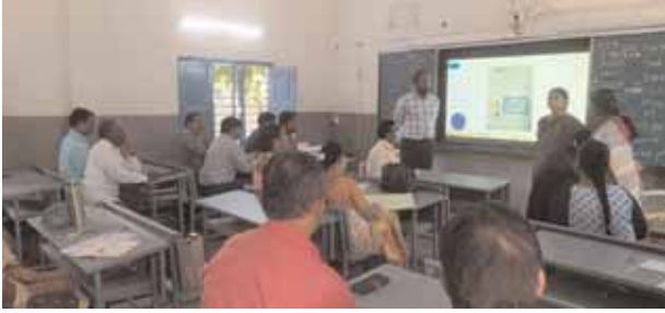
అలీవ్యెంట్ నర్సే (ఎన్ఎస్)కు అనుగుణంగా విద్యార్థులను తయారు చేయాలని డీఈఓ ఉపాధ్యాయులకు బోధించారు. ఈ కార్యక్రమంలో శామిర్ పేట జడ్పీ ఉన్నత పాఠశాల సూల్ కాంప్లెక్స్ పరిధిలోని 12 పాఠశాలలకు చెందిన 24 మంది ఉపాధ్యాయులు పాల్గొన్నారు.