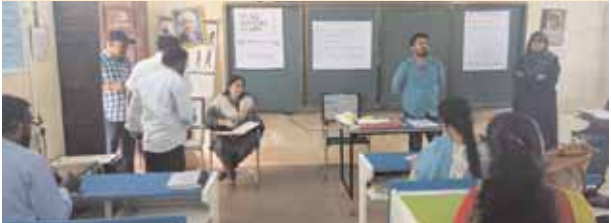
ఉపాధ్యాయిలకు సూచిస్తున్న డిఇఓ