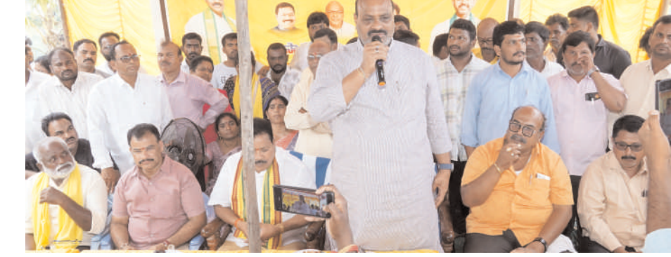
శ్రీకాకుళం, సెప్టెంబర్ 1, మేజర్ న్యూస్

ఎత్తిపోతల పథకాలకు త్వరలోనే ఎన్నికలు : రాష్ట్ర వ్యవసాయ శాఖామంత్రిలు కింజరాపు లచ్చెన్నాయుడు