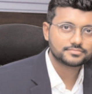
విశాఖపట్నం, సెప్టెంబర్ 1, మేజర్ న్యూస్

వర్షాల ప్రభావంతో బెల్గాల్ నిర్వహణ విద్యుత్తు సరఫరా వ్యవస్థను యుద్ధప్రాతిపదికన పునరుద్ధరిస్తున్నామని ఏపీఈపీడీసీఎల్ సీఎం డి పృథ్వితేజ్ ఇమ్మడి పేర్కొన్నారు. ముఖ్యమంత్రి నారా చంద్రబాబు నాయుడు, ఇంధనశాఖ మంత్రి గొట్టిపాటి రవికుమార్, ఇంధనశాఖ కార్యదర్శి కె విజయా సుందర్ అధికారికంగా సందర్శించి విద్యుత్తును అధికారులతో బెల్గాల్ నిర్వహణ విద్యుత్తు త్వరితగతిన పునరుద్ధరించేందుకు అవసరమైన చర్యలు తీసుకోవాలని కోరారు. ప్రభుత్వ ఆసు పత్రాలకు, సాఫ్ట్ టవర్లకు, అత్యవసర నగ్నిస్తులు అందించే ప్రభుత్వ కార్యాలయాలకు విద్యుత్