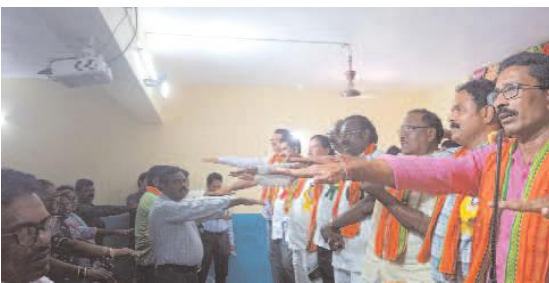
పూసపాటిరేగ, సెప్టెంబర్ 15, మేజర్స్ హాలు: