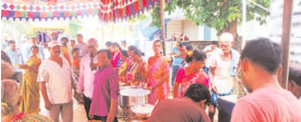
సీతంపేట, సెప్టెంబర్ 15, మేజర్స్ హాలు:

శ్రీ శ్రీ విద్ది వినాయక సమాధి సమాఖ్య వాలు అన్నదాన కార్యక్రమం ఆదివారం సీతంపేట ఎస్ డి స్కూల్ లో ఘనంగా జరిగింది. గ్రామంలో సవరణకు ఉన్నవారు జరగడంతో ఊరుంకా కడలిపల్లి వినాయకుని తొలి ఆశీస్సులు పొందినంతరం భోజనాలుచేశారు. దాదాపు అన్నీవీడులునుండి ప్రజానీకం పెద్ద ఎత్తున పాల్గొన్నారు. వినాయక కమిటీ సభ్యులు భక్తులకు ఎటువంటి ఆసౌకర్యం లేకుండా ఏర్పాటు చేశారు. గత 30 ఏళ్లు గా ఎస్ డి కాలనీలో వినాయక సమాధి వాలు కొనసాగుతుంది.