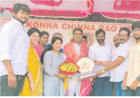
శ్రీకాకుళం, సెప్టెంబర్ 15, మేజర్స్ హాలు: