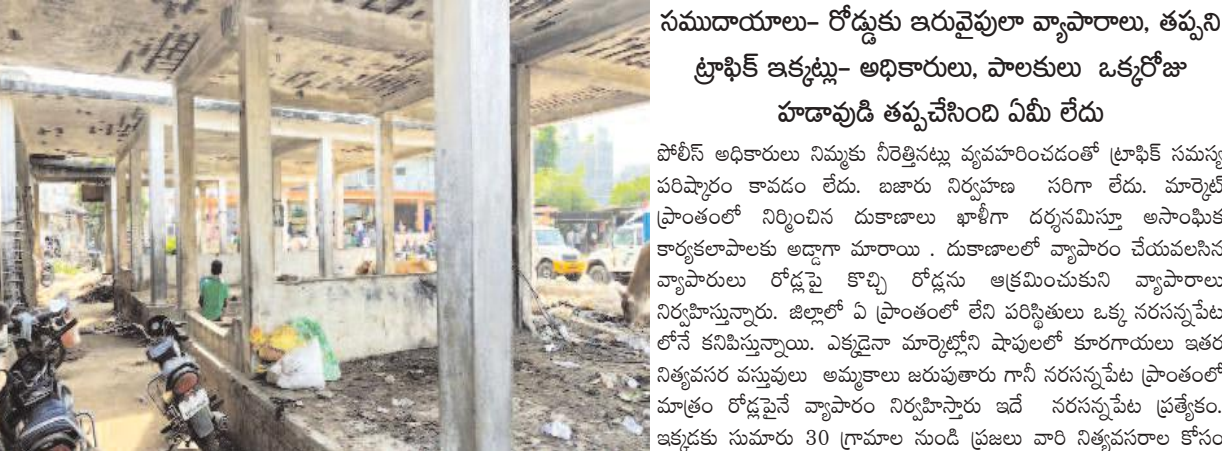
నరసన్నపేట, సెప్టెంబర్ 15, మేజర్ సూర్య:

నరసన్నపేట మేజర్ పంచాయతీ పరిధిలో లక్ష్మలాది రూపాయలు వెచ్చించి నిర్మించిన కూరగాయల మార్కెట్ నిరుపయోగంగా మారడంతో, రోడ్ ఎక్కిన వ్యాపారం. పట్టణ ప్రధాన రహదారి నుండి, కళాశాల రహదారి, బజారు ప్రాంతంలో రోడ్ల కి ఇరువైపులా వ్యాపారాలు నిర్వహిస్తూ పట్టణ వాసులకు పట్టుదగలే చుక్కలు చూపిస్తున్నారు. నిరంతర ట్రాఫిక్ లతో ఇబ్బందులకు గురి చేస్తున్నారు. స్పందించవలసిన గ్రామపంచాయతీ యంత్రాంగం, నరసన్నపేట