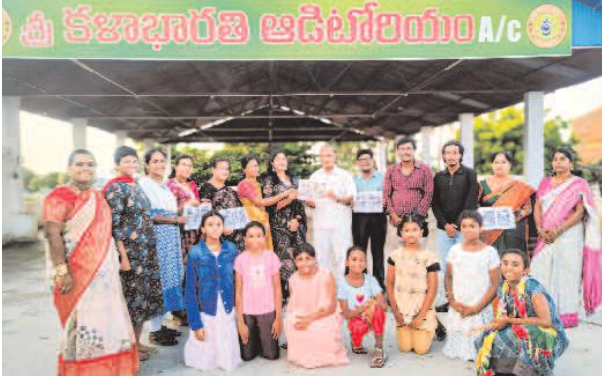
బోధిని, సెప్టెంబర్ 15, మేజర్స్ హాలు: