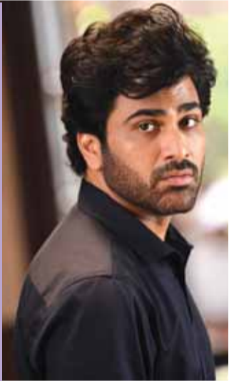
'మార్మిన్' లేటెస్ట్ టైలర్ అక్టోబర్ 11న చిత్రం విడుదల

చార్మింగ్ స్టార్ శర్వా వెర్మన్ పుష్ప 2లో డిఫెండ్ ప్రొసెక్యూటర్ అలరిస్తున్నారు. తన ప్రతిష్టాత్మక ప్రాజెక్ట్ చర్యనంద్ 38 కోసం మాన కమర్షియల్ ఎంటర్టైన్మెంట్ రూపొందించడంలో పేరుపొంది డిజైన్మెంట్ మేకర్ సంపత్ నందితో చేతులు కలిపారు. లక్ష్మీ రాధామోహన్ సమర్థనలో శ్రీ సత్యసాయి అర్బన్ పై బడ్జెట్లో, అత్యున్నత సాంకేతిక ప్రమాణాలతో ప్రముఖ నిర్మాత కెకె రాధామోహన్ ప్రతిష్టాత్మకంగా ఈ చిత్రాన్ని నిర్మించనున్నారు. ఇది 1960లో ఉత్తర తెలంగాణ, తెలంగాణ-మహారాష్ట్ర సరిహద్దులో రూరల్ బ్యాక్ డ్రాప్ లో సాగే పల్లెటింగ్ వీరియల్ యాక్షన్ డ్రామా. శర్వా 38 గ్రేటింగ్ యాక్షన్, ఎమోషనల్ చార్మ్ సీక్వెన్స్ లో ఇంటిన్స్ నెర్రీవ్ గా వుంటుంది. ఇంతకు ముందే చూడని ఎలిమెంట్స్ తో ఫస్ట్ అఫ్ ఇన్స్ క్రెడ్ మామీగా వుండబోతోంది. సబ్జెక్ట్ యూనివర్సల్ అప్పీల్ వుండటంతో మేకర్స్ దీనిని పాన్ ఇండియా స్థాయిలో రూపొందిస్తున్నారు. శర్వా, సంపత్ నంది ఇద్దరికీ ఇది మొదటి పాన్ ఇండియా మూవీ. సినిమా కోసం పవర్ ఫుల్ ప్రొమోషన్ రిలీ చేసిన దర్శకుడు, శర్వాను మునుపెన్నడూ చూడని క్యారెక్టర్లో ప్రెజెంట్ చేస్తున్నారు, 60ల నాటి క్యారెక్టర్ ని పోషించేందుకు శర్వా కంప్లీట్ గా మేకప్ అయ్యారు. అసాన్స్ మెంట్ పోస్టర్లో మంటలు చెలరేగుతున్నట్లు కనిపించడం ఆసక్తికరంగా వుంది.