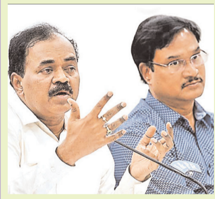
మానీకి, దాని పరివాహక ప్రాంతాలకు పూర్వజన్మం తెచ్చేలా 2026 జూన్ వరకే పన్నీ సీటిని కుద్ది భారీ నష్టం జరిగింది. ఇప్పుడు చిన్న పన్నాలకే చేసి మంచినీళ్లను ప్రవహింపజేయాలన్నదే సీఎం