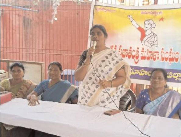
ప్రభుత్వ రికార్డుల ప్రకారం నూటికి 56 శాతం మంది మహిళలు రక్తహీనతకు గురి కావడం, పోషకాహారం అందక అనేక జబ్బుల పాలు అవ్వడం జరుగుతున్నారన్నారు. ఇంటి బయట ఉత్పాదక అనుత్పాదకరంగాలలో ను,