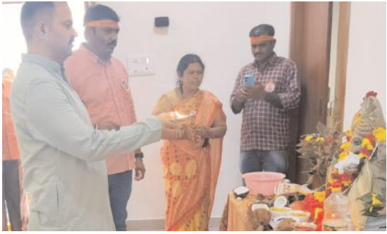
బోజ్జ గణపయ్యను నిమజ్జనానికి తరలించిన