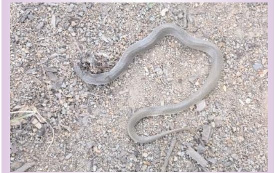
ఖాదర్ పేట పోస్ట్ ఆఫీస్ లో

అయితే ఆ గ్రామ ప్రత్యేక అధికారి మాత్రం ఈ విషయాన్ని ఇంతటితో వదిలేయండి మీరు ఇచ్చిన మెమోకు వివరణ అవసరం లేదు, అప్పటి ఇంచార్జ్ జిల్లా పంచాయతీ అధికారి నా మిత్రుడే కాబట్టి నేను మేనేజ్ చేసుకుంటానని సదరు కార్యదర్శి కి వత్తాసు పలుకుతూ సహకరించినట్లు గోవిందరావుపేట మండల వ్యాప్తంగా ప్రచారం సాగుతుంది. సర్పంచులు, పాలక మండలి సభ్యులు లేకపోవడం వల్ల గ్రామ పంచాయతీల పాలన, నిధుల దుర్వినియోగం ఏ మేరకు కొనసాగుతుందో మండలంలోని ఈ ఒక్క గ్రామ పంచాయతీ అర్థం పడుతుంది. జిల్లా కలెక్టర్, జిల్లా పంచాయతీ అధికారి ఇకనైనా ప్రత్యేక దృష్టి సారించి నిధులు దుర్వినియోగమైన గ్రామపంచాయతీలపై ఆరా తీయాలని, పంచాయతీ సొమ్మును పక్కదారి పట్టించిన అధికారులపై చర్యలు తీసుకోవాలని గ్రామస్థులు కోరుతున్నారు.