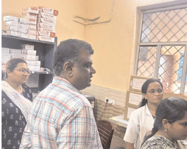
వర్కర్లు, తదితరులు పాల్గొన్నారు.