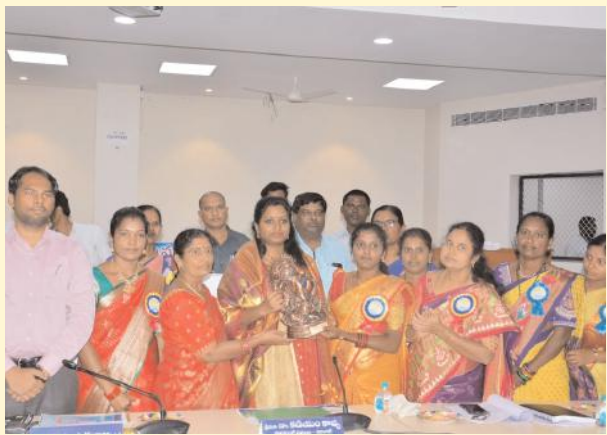
మహిళలు మహిళాశక్తి పథకంతో