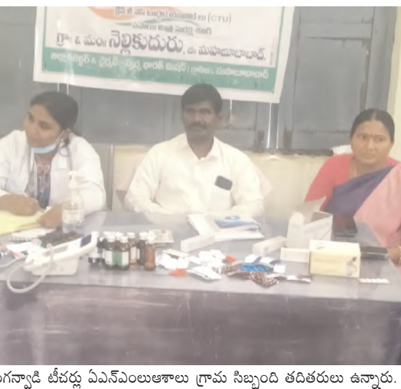
అంగన్నాడి టీచర్లు ఏఎన్ఎంల ఆశాలు గ్రామ సిబ్బంది తదితరులు ఉన్నారు.