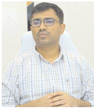
పోలీసులు సైబర్ కేటుగళ్ల ఆటకట్టించేందుకు సిద్ధమయ్యారు.