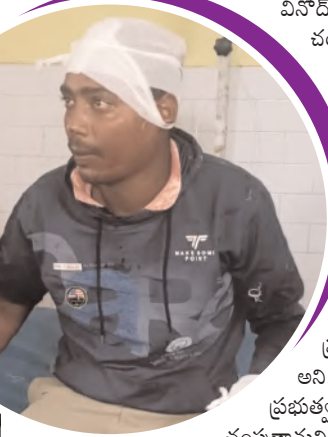
అటంకం కలిగించిన వ్యక్తుల మీద చట్టప్రకారం కేసు నమోదు చేసి దర్యాప్తు చేస్తున్నాని ఆయన తెలిపారు.