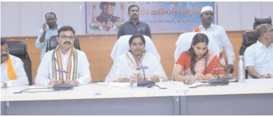
తెలంగాణ రాష్ట్ర సాధన కోసం జీవితాలను దారపోసిన