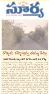
రోడ్డును కమ్మిస్తున్న తుమ్మ చెట్లు