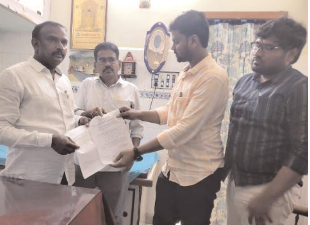
ప్రజలు వాపోతున్నారు. ఇకనైనా అధికారులు స్పందించి అవగాహన లేకుండా వైద్య చికిత్సలు అందిస్తూ ప్రజల ప్రాణాలతో వ్యాపారం చేస్తున్న ఆర్ఎంపీ వైద్యులపై కఠినంగా చర్యలు తీసుకోవాలని ప్రజలు అధికారులను వేడుకుంటున్నారు. ప్రాణాలు పోయాక హడావుడి చేసే కంటే ముందస్తుగానే ఆర్ఎంపీ కేంద్రాలను క్షుణ్ణంగా తనిఖీ చేసి ఎలాంటి ద్రువపత్రాలు లేని ఆర్ఎంపీలపై చట్టపరంగా చర్యలు తీసుకోవాలని ప్రజలు కోరుకుంటున్నారు.