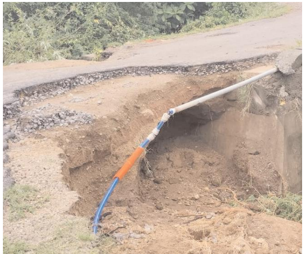
పనులు చేసే వాహనదారులకు, లాలుతండా గ్రామ ప్రజలకు ఇబ్బంది కలగకుండా వాహనాలు నడిచే విధంగా చూడాలి.

గత కొద్ది రోజులుగా కురుస్తున్న భారీ వర్షానికి బ్రిడ్జి ఇరువైపుల భాగం కుంగిపోయి రాకపోకలకు అడ్డంకిగా మారింది. ఇనుగుర్తి నుండి అన్నారం వెళ్ళడానికి ఇదే ప్రధాన రహదారి కావడంతో వేరే మార్గం లేక గ్రామ ప్రజలు ఆందోళన చెందుతున్నారు. కొత్త బ్రిడ్జి నిర్మిస్తే అందరికీ ఉపయోగపడుతుంది. కాని బ్రిడ్జి నిర్మించే వరకైనా తాత్కాలిక మరమ్మత్తుల