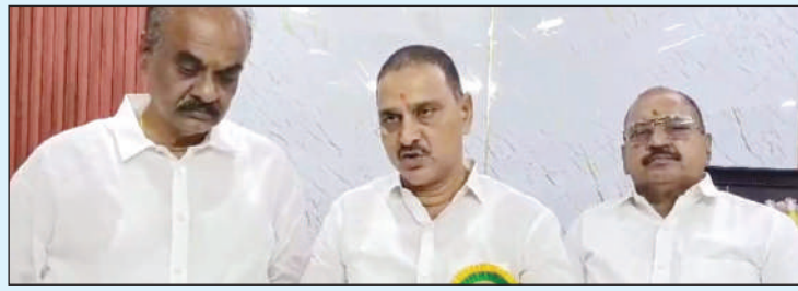
తాడేపల్లిగూడెం,మేజర్ స్టాన్ : కేంద్ర ఉక్కుభారీ పరిశ్రమల శాఖ సహాయ మంత్రి భూపతి రాజు శ్రీనివాస్ వర్మని స్థానిక ఎమ్మెల్యే బొలిశెట్టి శ్రీనివాస్ గృహానికి ఆహ్వానించారు.

- కేంద్ర మంత్రి పరమల ఎమ్మెల్యే బొలిశెట్టి వివేక్