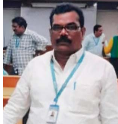
హాజరై నివాళులర్పించి కుటుంబ సభ్యులను పరామర్శించారు.

సమీపంలో మేకల మంద రోడ్డుకు అడ్డంగా రావడంతో ఒక్కసారిగా బ్రేక్ కొట్టారు. దీంతో బ్రేక్ అదుపుతప్పి రోడ్డుపై పడడంతో అతని తలకు తీవ్ర గాయమైంది. అటుగా వస్తున్న వారు గమనించి బ్యాంకు సిబ్బందికి సమాచారం అందించారు. వారు హుటాహుటిన సంఘటనా స్థలానికి చేరుకొని చికిత్స నిమిత్తం వింజమూరులోని ఓ ప్రైవేటు వైద్యశాలకు తరలించారు. అక్కడి వైద్యుల సూచన మేరకు మెరుగైన వైద్యం కోసం నెల్లూరు తరణిస్తుండగా మార్గమధ్యలో మృతిచెందాడు. ఉదయగిరిలో శనివారం జరిగిన ఆయన అంత్యక్రియలకు పలువురు బ్యాంకు ఉన్నతాధికారులు, ఉద్యోగులు