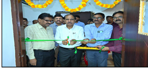
శ్రీరాంపూర్, అక్టోబర్ 23, సూర్య మేజర్ స్కూల్స్: