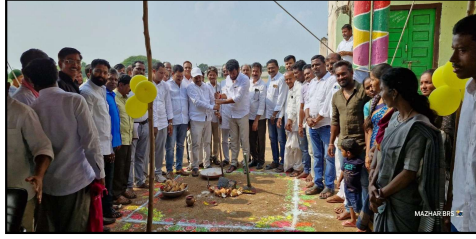
ఇన్స్పెక్టర్ అక్టోబర్ 23 సూర్య మేజర్ స్కూల్స్