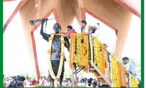
ప్రాంత ప్రజల కష్టాలను, ఇబ్బందులను ఒక నివేదిక రూపంలో రిసెర్చ్ చేసి ఆనాటి ప్రభుత్వానికి అందిస్తే ... మిగిలా.. 4లో

- పోరాట యోధుడికి ఘనంగా నివాళిర్పించిన సీతక్క - సాంప్రదాయ పద్ధతిలో పూజలు నిర్వహించిన మంత్రి సీతక్క ఆదిలాబాద్, 17 అక్టోబర్, సూర్య మేజర్ న్యూస్ పంచాయితీ, గ్రామీణాభివృద్ధి శాఖ, మహిళా శిశు సంక్షేమశాఖ మంత్రి సీతక్క దనసరి అసనూయ మాట్లాడుతూ మన పోరాట యోధుడు, హక్కుల నేత, మనకు ఆత్మ గౌరవాన్ని ఆదివాసి జాతులకు అస్తిత్వాన్ని కలిగించినటువంటి మహా త్యాగం చేసినటువంటి కొమురంభీం యొక్క 84వ వర్ధంతి సందర్భంగా ఇక్కడికి వచ్చినటువంటి అందరికీ రాంరాం తెలుపుతూ కొమురంభీం లేకపోతే మనమందరం ఇక్కడికి వచ్చేవారమే కాదని, వారి యొక్క పోరాటం, త్యాగ ఫలితంగా ఎక్కడో ఉన్న హేమన్ డార్స్ ఈ ప్రాంతానికి వచ్చి, ఈ