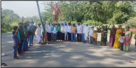
జన్నారం, అక్టోబర్ 17, సూర్య మేజర్ స్టూన్ :