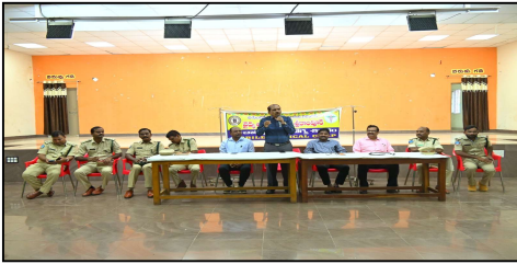
శ్రీరాంపూర్, అక్టోబర్ 19, సూర్య మేజర్ స్టూన్స్: