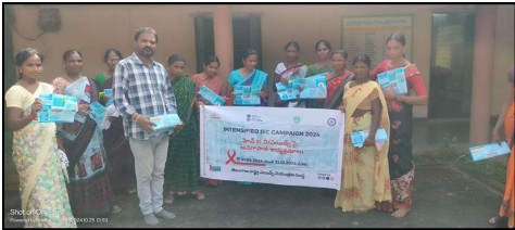
కడం, అక్టోబర్ 25, సూర్య మేజర్ న్యూస్ :