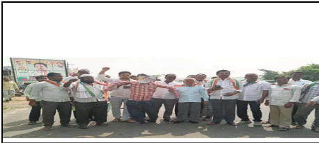
నేరడిగొండ అక్టోబర్ 25