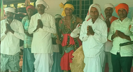
గుడిపత్తూర్, అక్టోబర్, 30 మేజర్ సూర్య స్టాన్స్:

మండలంలోనితోపాటు గ్రామంలో ప్రతి సంవత్సరం జరుపుకునే గుస్సాడి దప్పు చెప్పుళ్ల, తుడుంమోతలు గజ్జల సవ్వళ్లు, మహిళల రీలాపాటలు యువకుల చవోయ్ (కోలాటాలు) నృత్యాలు సంప్రదాయాల నృత్యాలతో ఆదివాసి గ్రామాలలో గుస్సాడి(దండారి) చప్పుళ్లు షారు అయ్యాయి ఆదివాసి గోండు గుడాలలో ప్రారంభమైనాయి సంస్కృతి సంప్రదాయాలను ఆచార వ్యవహారాలను ఆచార వ్యవహారాలకు ప్రతికంగా నిలిచే గుస్సాడి (దండారి) ప్రారంభమైనయ్యాయి సంస్కృతి సంప్రదాయాలను ఆచార వ్యవహారాలను ఆదివాసుల ప్రాణాపదంగా భావిస్తారు ముఖ్యంగా దండారి సంబరం ఆదివాసి గోండు గుడాలలో అంబరాన్ని అంటుకుంటుంది ఆదివాసి పెద్ద పండుగ అంటే దండారి అని చెప్పవచ్చు దీపావళి ముందు భోగి లో ప్రారంభమయ్యే దండారి ఉత్సవాలు దీపావళి తర్వాత కొలబోడితో ముగిస్తాయి గుస్సాడిలు చాలా కీలకం దీపావళి పండుగా నైవేద్యంతో ఆదివాసి గ్రామాలలో ప్రతి గోండు గూడిలలో ఘనంగా నిర్వహిస్తారు ఏ ఆదివాసి గ్రామాలలో చూసిన గుస్సాడి చప్పుళ్లు వినిపిస్తాయి దండారి సమూహాలుగా చేరి సాంప్రదాయ నృత్యాల పరిరక్షిస్తారు దండారిలో గుస్సాడి ల వేచధారణ ప్రత్యేక ఆకట్టుకునేలా ఉంటుంది అందరూ