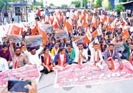
యువ గళం హామీ మేరకు జూనియర్ కళాశాలలో మిడ్ డే మిల్స్ అమలు చేయాలని ఏఐఎస్ఎఫ్ ఆధ్వర్యంలో వేలాదిమంది విద్యార్థులతో కలెక్టరేట్ ఎదుట ధర్నా చేసిన పాత చిత్రం

ఉపముఖ్యమంత్రి పవన్ కళ్యాణ్ సూచనల మేరకు డొక్క సీతమ్మ మధ్యాహ్న భోజన పథకం అమలైతేనే ఉపయోగం..