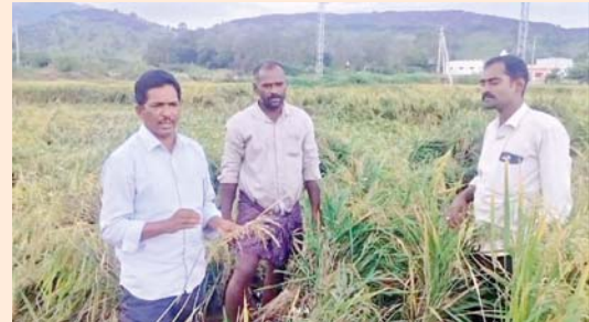
పంట పూర్తిగా దెబ్బ తిన్నట్లే. వ్యవసాయ అధికారులే పరిహారం అందించి న్యాయం చేయాలి.

బుక్కపట్నం మేజర్ న్యూస్ : గత రెండు రోజులుగా కురిసిన భారీ వర్షాలకు బుక్క పట్నం చెరువు కింద వరి పంట పూర్తిగా నేల వాలింది. మండలంలోని బుక్కపట్నం, బుచ్చయ్య గారి వల్లి, గూనిపల్లి, కొత్తకోట వివిధ గ్రామాల్లో విస్తారంగా వరి సాగు చేపట్టారు. పెట్టుబడులకు వెనుకాడకుండా రైతులు పంటను సంరక్షిస్తూ వచ్చారు. గత రెండు రోజులుగా కురిసిన భారీ వర్షాల రైతుల పాలిట శాపంగా, గింజ పట్టే సమయంలో వరి పంట నేల వాడడంతో లక్షలాది రూపాయల నష్టం వాటిల్లింది. ఎకరం వరి పంట సాగు చేయాలంటే 20,000 నుంచి 25 వేల రూపాయల వరకు ఖర్చవుతోంది. ప్రస్తుతం వర్షాల వల్ల పంట దెబ్బ తినడంతో పెట్టిన పెట్టుబడి కూడా వచ్చే పరిస్థితి కనిపించడం లేదు. వ్యవసాయ అధికారులు స్పందించి పంట పొలాలను పరిశీలించి రైతులకు పరిహార అందించి ఆదుకోవాలని పలువురు కోరుతున్నారు.