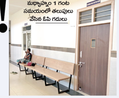
మధ్యాహ్నం 1 గంట సమయంలో తలుపులు వేసిన ఓపి గదులు

వైద్యుల నిర్లక్ష్యంపై కథనం రావడంతో తూతూ మంత్రంగా సమావేశాలు ఇకమీదట అలా జరగదని ఆసుపత్రి సూపరింటెండెంట్ సూర్య దినపత్రికకు ఎక్స్ప్లినేషన్ లెటర్ అయినా సమయపాలన పాటించడంలో వైద్యులు అదే నిర్లక్ష్యం వైద్యులపై చర్యలు తీసుకోవడం మా బాధ్యత కాదంటూ చేతులెత్తిస్తున్న సూపరింటెండెంట్ ఆసుపత్రిలో మల మూత్ర విసర్జనకు వెళ్లాలంటే ఒకరు కాపలాగా బయట ఉండాల్సిందే చీకటి పడగానే మూతపడుతున్న ఆసుపత్రిలోని బ్లడ్ బ్యాంక్