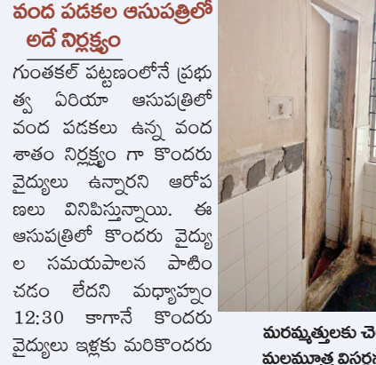
మరమ్మత్తులకు చెందిన మలమూత్ర విసర్జన గది