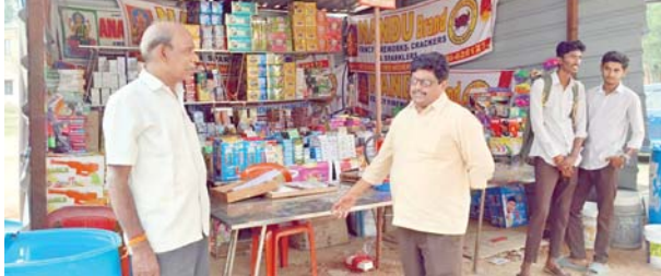
ప్రజలు, కొనుగోలుదారులు తదితరులు పాల్గొన్నారు.