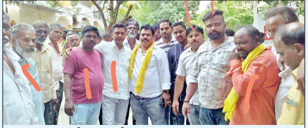
ఇందులో కొందరు నేరచరిత్ర ఉన్న వ్యక్తులుగా అనుమానం ఇప్పుడు ఇలా.. తనకు సంబంధించిన కొందరు వ్యక్తులకు కండువలు వేయించి టిడిపిలో చేరుతున్నట్లుగా..