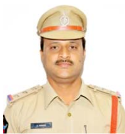
హౌస్ మానిటరింగ్ సిస్టంను వినియోగించుకుని తాళం వేసిన ఇళ్లలో చోరీలకు చెక్ పెట్టండి అని సూచించారు.