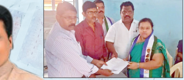
అందించడం విశేషం. ఇలాగే చెప్పకుంటూ పోతే..