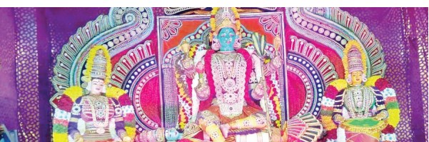
అనంతపురం కొత్తూరు అమ్మవారి శాలలో శ్రీ లలిత త్రిపుర సుందరి దేవి, సరస్వతి దేవి లక్ష్మీదేవి అలంకరణలో భక్తులకు దర్శనం ఇచ్చిన వాసవి మాత. • అనంతపురం విద్య మేజర్ స్కూల్

అనంతపురం విద్య మేజర్ స్కూల్ : అనంతపురం శ్రీ శివ బాలయోగి ఆశ్రమం అనంతేశ్వర స్వామి దేవాలయంలో దేవి శరన్నవరాత్రుల్లో భాగంగా నాలుగవ రోజు ఆదివారం అమ్మవారు కామాక్షి దేవి అలంకరణలో భక్తులకు దర్శన భాగ్యం కల్పించారు. అనంతేశ్వరి, అనంతేశ్వరుల మూల విగ్రహాలకు భక్తుల స్వహస్తాలతో పంచామృతాభిషేకం, ఏకవార రుద్రాభిషేకం, పంచ సూత్రాభిషేకం, కుంకుమార్చన, పుష్పార్చన గావించారు. మహా మంగళ హారతి అనంతరం భక్తులకు తీర్థ ప్రసాదాలను వినియోగించారు.