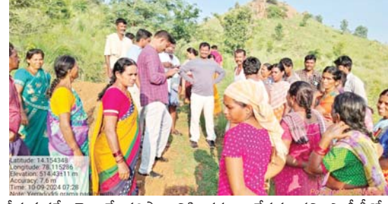
తీసుకువస్తే వెంటనే పరిష్కారానికి చర్యలు చేపడతానని ఎంపీడీవో కూలీలతో పేర్కొన్నారు. కార్యక్రమంలో ఎంపీడీవో పోలీసు వెంట ఉపాధి హామీ సిబ్బంది ఉన్నారు.

కదిరి, మేజర్ న్యూస్: జాతీయ గ్రామీణ ఉపాధి హామీ పథకాన్ని జాబ్ కార్డ్ కలిగిన ప్రతి ఒక్క కూలీ సద్వినియోగం చేసుకోవాలని ఎంపీడీవో పోలీసు కూలీలకు సూచించారు. బుధవారం కదిరి రూరల్ మండలంలోని ఎర్రదొడ్డి పంచాయతీ పరిధిలోని ఎర్రదొడ్డి తండా నందు కూలీలు చేస్తున్న ఉపాధి పనులను ఎంపీడీవో పరిశీలించారు. పద్దంలో భాగంగా ఎస్టీ వర్క్స్ ని ఎంపీడీవో సందర్శించారు. ఈ పథకం ద్వారా ప్రతికూలీ లబ్ధి పొందాలని సూచించారు. ప్రధానంగా కూలీలకు ఆర్థికంగా ఆదుకోవాలన్న ఉద్దేశంతో ఈ పథకాన్ని కేంద్ర రాష్ట్ర ప్రభుత్వాలు కొనసాగిస్తున్నట్లు కూలీలకు వివరించారు. పనుల వద్ద కూలీలకు తీసుకోవలసిన జాగ్రత్తలను సైతం ఎంపీడీవో తెలియ జేశారు. సందర్భంగా నే కూలీలకు సంబంధించిన మాస్టర్లను ఎంపీడీవో పరిశీలించారు. ప్రతికూలీకి కూలీకి గిట్టుబాటు అయ్యేలా పనులు చేసుకోవాలని సూచించారు. ఏమైన సమస్యలుంటే తన దృష్టికి