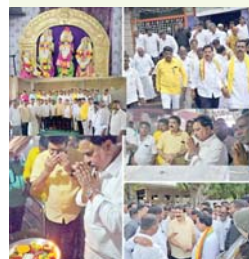
శిట్టూరు, మేజర్ స్వాస్ : అనంతపురం జిల్లా శెట్టూరు మండలం యూట కల్లు గ్రామంలోని అత్యంత విశిష్టత కలిగిన శ్రీ కుణే రామలింగేశ్వర స్వామి వారిని దర్శించుకున్న ఎమ్మెల్యే అమిలినేని సురేంద్ర బాబు, ఎంపీ అంబికా లక్ష్మీనారాయణ దర్శనం అనంతరం ఏడు శోరల అన్నదమ్ములు ఎమ్మెల్యే, ఎంపీలను ఘనంగా సత్కరించారు. అక్కడే నూతనం

కల్యాణమంటపం పూర్తికి నిధులు మంజూరు చేయిస్తాం - ఎంపీ, ఎమ్మెల్యే