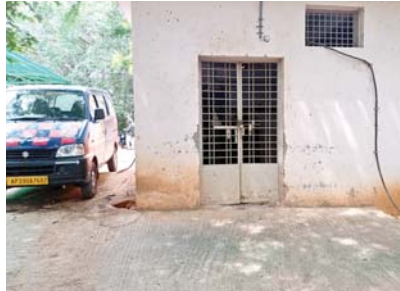
సిబ్బంది కనీస చర్యలు కూడా తీసుకోకపోవడంతో పరిస్థితి మరింత దారుణంగా మారిందని తీవ్ర స్థాయిలో విమర్శిస్తున్నారు.

అనంతపురం క్రైం, మేజర్ న్యూస్ : నగరంలోని ప్రభుత్వ సర్వజన ఆసుపత్రిలో మరోసారి దొంగలు తమ చాకచక్యాన్ని ప్రదర్శించారు. మంగళవారం అర్ధరాత్రి నగరంలోని ప్రభుత్వ సర్వజన ఆసుపత్రిలో ఉన్న ఆక్సిజన్ ప్లాంట్ లోని రాగి కడ్డీలను ఎత్తుకెళ్లిన వైనం చోటుచేసుకుంది. ప్రభుత్వ సర్వజన ఆసుపత్రిలో దొంగతనాల పరంపర కొనసాగుతూనే ఉంది. వీటికి అడ్డుకట్ట వేయాల్సిన వారు కరువైనారని తీవ్ర స్థాయిలో విమర్శలు వినిపిస్తున్నాయి. ప్రభుత్వ సర్వజన ఆసుపత్రిలో ద్వితీయ వాహనాలు, వాహనాలకు అమర్చిన బ్యాటరీలు, సెల్ఫోన్ లా దొంగతనాలు తరచుగా చోటు చేసుకుంటున్నా నేపథ్యంలో ఈసారి ఏకంగా ఆక్సిజన్ ప్లాంట్ కు అమర్చిన రాగి కడ్డీలను ఎత్తుకెళ్లిన వైనం చోటు చేసుకుంది. నిత్యం పర్యవేక్షణ ఉండాలని ప్రభుత్వ సర్వజన ఆసుపత్రిలో నిత్యం దొంగతనాలకు నిలయంగా మారింది. అధికార యంత్రాంగం సెక్యూరిటీ