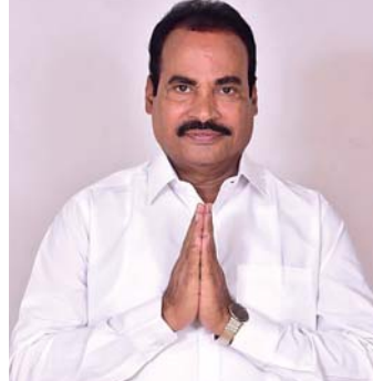
అసౌకర్యం కలుగకుండా ముందస్తు జాగ్రత్తలు తీసుకున్నట్లు తెలిపారు.

తుఫాన్ తీరం దాటే ముందు, తరువాత భారీ వర్షాలు పడే అవకాశం ఉన్నందున గురువారం మరింత అప్రమత్తంగా ప్రజలు ఉండాలని ఆయన కోరారు. ఇటీవల డ్రైనేజీ కాలువల్లో పూడిక తీయడం వల్ల నీళ్ళు నిలిచే అవకాశం తక్కువగా ఉన్నట్లు ఆయన తెలిపారు. మున్సిపల్ సిబ్బందితో పాటు విద్యుత్ శాఖ, రెవెన్యూ, పోలీసులు సమన్వయంతో 24 గంటలు అందుబాటులో ఉండేలా ప్రభుత్వం చర్యలు తీసుకున్నట్లు ఆయన చెప్పారు. లోతట్టు ప్రాంతాల ప్రజలకు ఎటువంటి