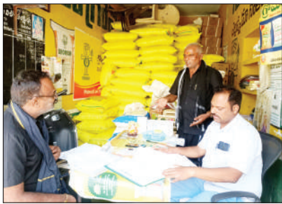
హెచ్చరించారు. డీలర్లు నిబంధనలను తప్పక పాటించాలన్నారు. రైతులు ఎరువులు, విత్తనాలను