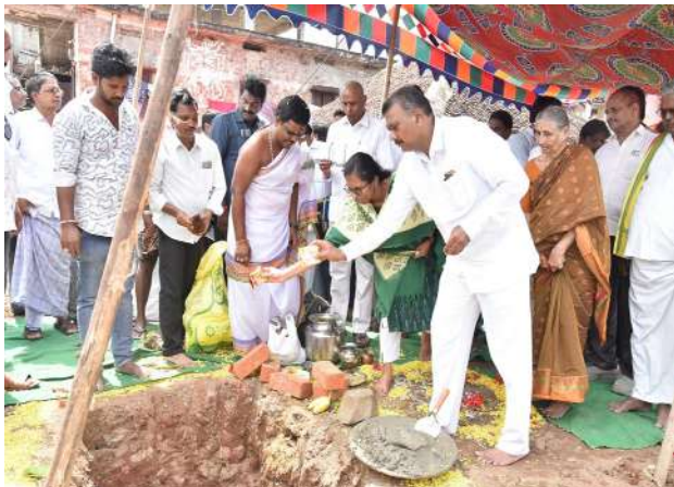
పున్నాయో తెలిసేది కాదని, పంచాయితీ సర్పంచ్ లు ధర్మాలు చేశారని గుర్తు చేశారు. పంచాయితీ నిధులు ఎవరో కాజేశారని కంప్లయంట్ కూడా ఇవ్వడం జరిగిందని తెలిపారు. ఈ రోజు పంచాయితీలకు నిధులు అందుతున్నాయన్నారు. 15 వ ఆర్థిక సంఘం నిధులు వస్తున్నట్లు తెలిపారు. ఈ నెల 14 వ తేదీ నుండి 20 వరకు ప్రతి గ్రామ పంచాయితీలో అనేక అభివృద్ధి కార్యక్రమాలు చేసుకుంటున్నామన్నారు. ముఖ్యంగా తాడికొండ మండలానికి రూ.75 లక్షలు, ఫిరంగిపురం మండలానికి రూ.75 లక్షలు, మేడికొండూరు మండలానికి రూ. 75 లక్షలు, తుళ్ళూరు మండలానికి రూ.75 లక్షలు మంజూరు అయ్యాయన్నారు. రూ. 3 కోట్లతో నియోజకవర్గంలో అభివృద్ధి పనులు జరుగుతున్నాయన్నారు. ఇంతే కాకుండా గ్రామ పంచాయితీ నిధులు, యంపీ లాడ్ నిధులు, సాంఘిక సంక్షేమ శాఖ నుండి అభివృద్ధి కార్యక్రమాలకు నిధులు అందుతాయన్నారు. తన పదవీ కాలం పూర్తి అయ్యే నాటికి గ్రామాల్లో మొత్తం రోడ్లు, డ్రైన్లు, మంచినీటి వర్షకాలు పూర్తి చేయడం జరుగుతుందని తెలిపారు. ఈ కార్యక్రమంలో పీడి డ్యూమా వి.శంకర్, తాడికొండ మండల తహశీల్దార్ నాసరయ్య, యంపీడీఓ సమతా వాణి, గుంటూరు జిల్లా తెలుగుదేశం పార్టీ కార్యదర్శి కంచర్ల శివరామయ్య, మండల క్లస్టర్ ఇన్ చార్జ్ యడ్లపల్లి సాంబశివరావు, మండల పార్టీ అధ్యక్షులు ప్రసన్న, జనసేన స్థానిక నాయకులు విజయశేఖర్, గ్రామ ప్రజలు పాల్గొన్నారు.