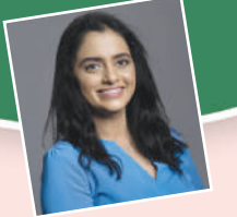
ప్రవంతి బైరపునేని ప్రముఖ ఆంకాలజిస్ట్ అరియా క్యాన్సర్ సెంటర్ అలితసూపర్ స్పెషాలిటీ హాస్పిటల్

బ్రెస్ట్ క్యాన్సర్.. చాపకింద నీరులా విస్తరిస్తున్న ఈ సమస్య రోజురోజుకీ తీవ్రమవుతూ మహిళల ప్రాణం తీస్తోంది.. అవగాహన లేమి కారణంగా చాలా ఈ మహమ్మారి బారిన పడుతున్నారు. అందుకే ముందు నుంచే మహిళలు ఈ సమస్య పట్ల అవగాహనం పెంచుకోవడం చాలా అవసరం. ఈ వ్యాధి లక్షణాలను ముందు గానే గుర్తించడం వల్ల సమస్య గురించి ముందునుంచే జాగ్రత్త పడొచ్చు, మరి ఆ లక్షణాలు ఏంటో ఇప్పుడు చూద్దాం.. రొమ్ము క్యాన్సర్ 2040 వాటికి సంవత్సరానికి లక్షల మరణాలకు కారణమవుతుంది.. నివేదిక2020 చివరి వరకు ఐదేళ్లలో 7.8 మిలియన్ల మంది మహిళలు రొమ్ము క్యాన్సర్ తో బాధపడు తున్నారని అదే సంవత్సరం 685,000 మంది మహిళలు ఈ వ్యాధితో మరణించారని పేర్కొంది.