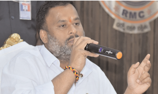
రాయచోటి, మేజర్ న్యూస్ :

అర్బులందరికీ పంచును, ఇళ్లు మంజూరు దీపావళి నుంచి మూడు సిలిండర్లు పంపిణీ రెవిన్యూ పెంచడానికి మున్సిపల్ కాంప్లెక్స్ ఏర్పాటు