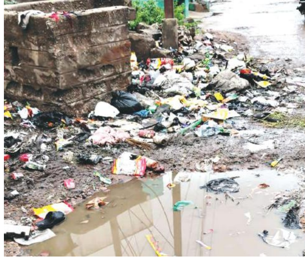
పిల్లలు, విద్యార్థులు, మహిళలు బయటికి రావడానికి తీవ్రమైన ఇబ్బందులు ఎదుర్కొంటున్నారు. ప్రస్తుత కాలమి ప్రభుత్వమైన ప్రజల ఇబ్బందులను పట్టించుకుని వీధులలో చక్కటి సిమెంట్ రోడ్లు వేసి డ్రైనేజీ వ్యవస్థను మెరుగు పరచాలని ప్రజలు కోరుకుంటున్నారు.

పోరుమామిళ్ల, మేజర్ న్యూస్: పోరుమామిళ్ల మేజర్ గ్రామపంచాయతీ పరిధిలో రోడ్డు అధ్యానంగా ఉండటంతో జనజీవనం అస్తవ్యస్తంగా సాగుతుంది. చిన్నపాటి వర్షం కురిసినా రోడ్డు జలయమయై చిన్నపాటి చెరువులను తలపిస్తున్నాయి. గత ప్రభుత్వ హయాంలో పోరుమామిళ్లలోని ఫైర్ ఆఫీస్ నుండి మలకత్తువ వరకు 25 కోట్ల రూపాయలతో రోడ్డు విస్తరణ పనులను ఎంతో ప్రతిష్టాత్మకంగా ప్రారంభించినప్పటికీ అవి సకాలంలో పూర్తి కాకపోవడం వలన అనేక ఇబ్బందులు ఎదురవుతున్నాయి. వాన వస్తే చాలు ప్రజలు రోడ్డుపైకి రావడానికి తీవ్రమైన ఇబ్బందులు ఎదుర్కొంటున్నారు. డ్రైనేజీ వ్యవస్థ సరిగా లేకపోవడం వలన మురికి నీరంతా రోడ్డుపై ప్రవహిస్తుంది. మే నెలలో సాధారణ ఎన్నికలు రావడంతో ఎన్నికల కోడ్ కారణంగా పనులు ఆగిపోయాయి. రోడ్డుపై అక్కడక్కడ గ్యాప్ లు వదలడంతో చిన్న వాటి వర్షం పడిన అక్కడ నీరు నిలిచి చాలా ఇబ్బందులు ఎదురవుతున్నాయి. అలాగే రోడ్డుపై అక్కడక్కడ గుంతలు ఏర్పడడంతో ఆ గుంతలలో నీరు చేరి ట్రాఫిక్ కు తీవ్ర అంతరాయం కలుగుతుంది. ఇక పోరుమామిళ్ల గ్రామపంచాయతీ పరిధిలోని పలు వీధులలో రోడ్డు దుర్భరంగా ఉన్నాయి. ఎక్కడ చూసినా రోడ్ల వెంబడి గుంతలు పడి నీరు నిలిచి ప్రజాజీవనం అస్తవ్యస్తంగా మారుతుంది. పలు వీధులలో చెత్తకుండీలు సరిగా లేక కనుపు, వ్యర్థాలు రోడ్డుపైకి వచ్చి దుర్భర పూరితమైన వాతావరణం ఏర్పడుతుంది. కుక్కలు, పందులు ఈ దుర్భర వాతావరణాన్ని మరింత అధికం చేస్తున్నాయి. ఫలితంగా దోమలు అధికమై పిల్లలు, వృద్ధులు పలు అంటురోగాల బారిన పడుతున్నారు. పలువీధులలో గతుకుల రోడ్లతో ప్రజలు సతమతమవుతున్నారు. వర్షం పడితే చాలు చిన్న