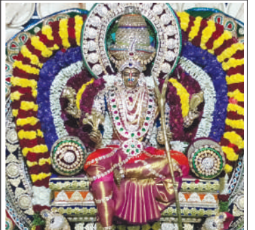
పోడుమామిళ్లలో రాజరాజేశ్వరి దేవి అలంకరణ అమ్మవారు.