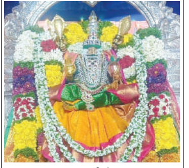
పులివెందులలో దీక్షబంధన అలంకారంలో అమ్మవారు