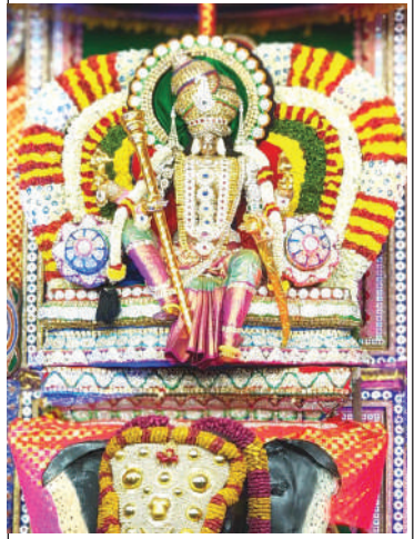
బద్వేల్ శ్రీ కన్యకా పరమేశ్వరి దేవస్థానంలో ప్రత్యేక అలంకారంలో అమ్మవారు.

జరుగుతుందన్నారు. ఐదేళ్లలో ఏపీఎస్ ఆర్టీసీ పూర్తిగా నిర్వీర్యం అయిందని రాజ్ బోయ్ కాలంలో ఏపీఎస్ ఆర్టీసీని ప్రక్షాళన చేసి ప్రయాణికులకు నాణ్యమైన సేవల అందించే విధంగా చర్యలు తీసుకుంటామన్నారు. రాష్ట్రవ్యాప్తంగా మరిన్ని నూతన ఆర్టీసీ బస్సులను కొనుగోలు చేసి ప్రయాణికులకు ఇబ్బంది లేకుండా చూస్తామన్నారు. ఈ సందర్భంగా రాయచోటి నుంచి విజయవాడకు, మదనపల్లి నుంచి విజయవాడకు సూపర్ లగ్జరీ బస్సు, రాయచోటి నుంచి తిరుమలకు డైరెక్టుగా రెండు సప్లగ్గర్ ఎక్స్ ప్రెస్, పీలేరు నుంచి తిరుపతికి మూడు బస్సులు అందులో ఒకటి ఆర్టీసీ రెండు ఎక్స్ ప్రెస్ బస్సులు, రాయచోటి నుంచి వేంపల్లి కు ఒక ఎక్స్ ప్రెస్ మొత్తం తొమ్మిది నూతన బస్సులను మంత్రి ప్రారంభించారు. ఈ సందర్భంగా రాయచోటి బస్టాండ్ నుంచి ఎస్ఎస్ కాలనీ వరకు భారీ ర్యాలీ నిర్వహించారు.