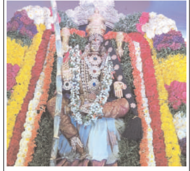
ముద్దనూరులో శ్రీ రాజరాజేశ్వరి దేవి అలంకారం