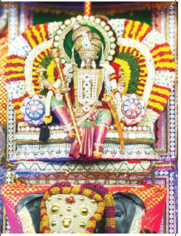
చెన్నూరులో శైలపుత్ర అలంకరణలో చౌడేశ్వరి అమ్మవారు