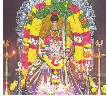
కన్యకేశ్వరిలో శ్రీ రాజరాజేశ్వరి దేవి అలంకారంలో శ్రీ బాలాత్రిపుర సుందరి దేవి