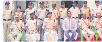
గ్రామాలు దూరంగా ఉన్నప్పటికీ 10నిమిషాలలో పోలీసులు చేరుకొనే విధంగా పనిచేస్తున్నారని అన్నారు. పోలీస్ స్టేషన్ లో సిబ్బంది పనితీరు భేష్ గా ఉందన్నారు. ఈ సందర్భంగా పెండింగ్ లో ఉన్న కేసుల గురించి, పెండింగ్ లో ఉన్న కేసుల పై రివ్యూ చేయటం గురించి, కేసుల సమయ శాంతి భద్రతల పరిరక్షణకు సంబంధించిన వివరాలను అడిగి తెలుసు కొన్నారు. రిపేషన్ వర్కిలో నిర్వహిస్తున్న మహిళా కానిస్టేబుల్ ను పిటిషన్ మేనేజ్ మెంట్ లో ఎంట్రీ చేసిన డేటాను తనిఖీ చేశారు. రిపేషన్ నిష్పత్తి ప్రతి దరఖాస్తుపై పిటిషన్ చేసిన వ్యక్తికి రిపేషన్ ఇవ్వాలని సూచించారు.