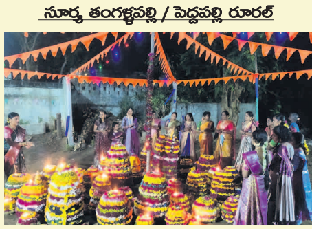
సూర్య తంగళ్లపల్లి / పెద్దపల్లి రూరల్