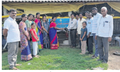
బాగుంటుందని తెలిపారు. మంచి సంరక్షణ పద్ధతులు పాటిస్తూ పెరటికోళ్ళు పెంచడం ద్వారా మరో ఏడు వారాల్లో గ్రుడ్లు పెడుతాయని తద్వారా కోళ్ళ సంఖ్య పెంచుకోవచ్చని రెండు నెలల తర్వాత కోళ్ళ అమ్మకం ద్వారా రెట్టింపు ఆదాయాన్ని పొందవచ్చన్నారు. మదర్ యూనిట్