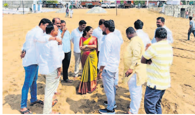
మహిళలు ప్రశాంతంగా ఆడుకునేందుకు మున్సిపల్ తరపున అన్ని ఏర్పాట్లు పూర్తి చేశామని మున్సిపల్ అధికారులు తెలిపారు.

మూల వాగు బతుకమ్మ తెప్ప వద్ద మహిళలు ఆడుకునే విధంగా మున్సిపల్ సిబ్బంది, గ్రౌండ్ ను చదును చేశారు. దారి పొడవునా ఎల్ఈడి లైట్లతో పాటు వారు ఆడుకునే ప్రదేశాల్లో విద్యుత్ లైట్లు ఏర్పాటు చేశారు. ఒక వేళ విద్యుత్ అంతరాయం ఏర్పడితే దానికి అనుగుణంగా జనరేటర్లను సైతం ఏర్పాటు చేయడం జరిగింది.