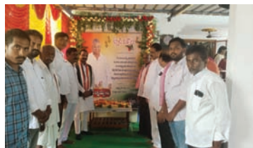
నేలకొండపల్లి సూర్య మేజర్ స్వామి మండల పరిధిలో కొత్త కొత్తూరు గ్రామంలో చేతి గాయంతో బాధపడుతున్న కాంగ్రెస్ పార్టీ జిల్లా

-కాంగ్రెస్ పార్టీ జిల్లా అధ్యక్షుడు, రాష్ట్ర గెడ్డంగుల సంస్థ చైర్మన్