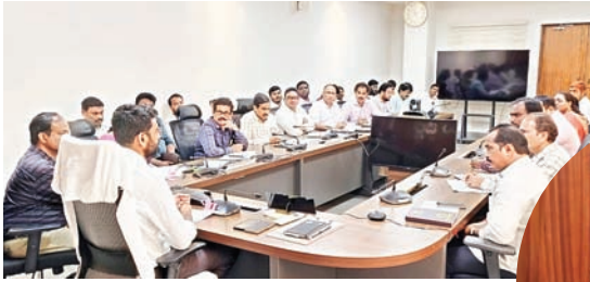
జిల్లా కలెక్టర్ జితేష్ వి పాటిల్

కొత్తగూడెం కలెక్టరేట్, సూర్య (మేజర్ న్యూస్)- జిల్లాలో గ్రామపంచాయతీ స్థాయిలో పెండింగ్ ఉన్న ఎల్ఆర్ఎస్ దరఖాస్తులను త్వరితగతిన పూర్తి చేయాలని కలెక్టర్ జితేష్ వి. పాటిల్ అధికారులను ఆదేశించారు. గురువారం ఐడిఓసి సమావేశ మందిరంలో ఎల్ఆర్ఎస్ దరఖాస్తుల పై సమీక్ష సమావేశం నిర్వహించారు. ఈ సందర్భంగా ఆయన మాట్లాడుతూ జిల్లాలోని గ్రామీణ స్థాయిలో ఉన్న ఎల్ఆర్ఎస్ క్రమబద్ధీకరణ దరఖాస్తుల పరిశీలన ప్రక్రియ వేగవంతంగా పూర్తి చేయాలని అధికారులను ఆదేశించారు. ప్రభుత్వ మార్గదర్శకాలకు అనుగుణంగా తమ