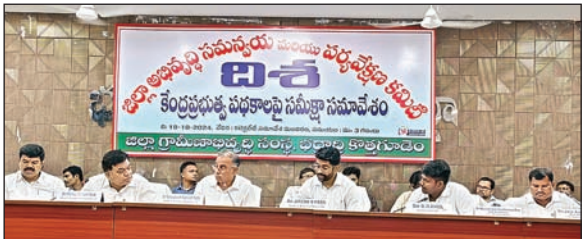
పారదర్శకంగా లబ్ధిదారుల ఎంపిక జరగాలి