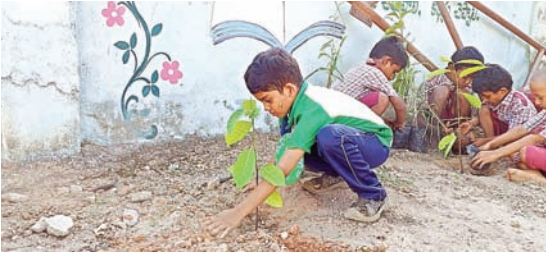
వయసు చిన్నది ఆశయం గొప్పది

రెండేళ్ల వయసు నుండే మొక్కలు నాటుతూ పర్యావరణాన్ని కాపాడుతున్న బాలుడు