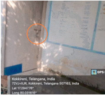
Kokkireni, Telangana, India 72°J+XJR, Kokkireni, Telangana 507163, India Lat 17.294778° Long 80.031616°

గ్రామీణ ప్రాంతాల్లో ప్రజలకు వైద్యసేవలు చేరువ చేయాలన్న ఉద్దేశంతో ఏర్పాటు చేసిన ఆరోగ్య ఉప కేంద్రాలు కు ఉన్నతాధికారుల పర్యవేక్షణ కొరవడింది. దీంతో వైద్యులు, సిబ్బంది సమయపాలన పాటించడం లేదు. తిరుమలాయపాలెం మండల కేంద్రంలోని కొక్కిరేణి ఆరోగ్య ఉప కేంద్రాన్ని శుక్రవారం మధ్యాహ్నం 2.30 గంటలకు పరిశీలించగా.. తాళం వేసి కనిపించింది. ఉదయం నుంచి సాయంత్రం నాలుగు గంటల వరకు సిబ్బంది ప్రజలకు అందుబాటులో ఉండి సేవలందించాల్సి ఉండగా.. ప్రతిరోజు మధ్యాహ్నమే తాళాలు వేసివెళ్లిపోతున్నారని స్థానికులు చెబుతున్నారు.