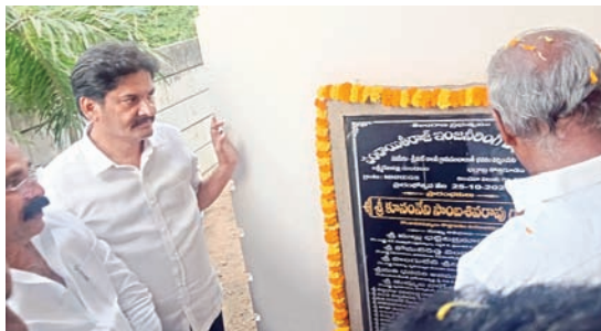
రూ.20 లక్షలతో నిర్మించిన శ్రీనగర్ జపి కార్యాలయాన్ని ప్రారంభించిన ఎమ్మెల్యే