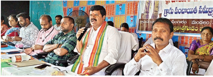
మణుగూరు, సూర్య (మేజర్ న్యూస్) - మండల పరిధిలో విప్లవసంగారం గ్రామపంచాయితీ లో విద్య, వైద్య, ఇరిగేషన్, ఫారెస్ట్, ఎలక్ట్రికల్, అగ్రికల్చర్, రెవెన్యూశాఖల అధికారులతో ఎమ్మెల్యే పాయం వెంకటేశ్వర్లు శుక్రవారం సమీక్షా సమావేశం నిర్వహించారు.