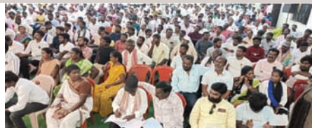
ఖమ్మం (సూర్య బ్యూరో):