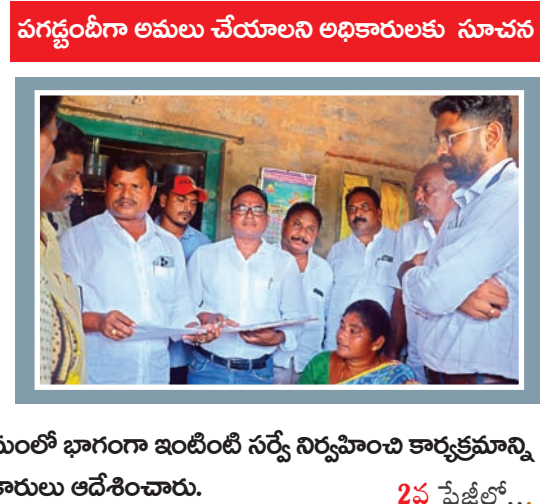
పక్కంబీగా అమలు చేయాలని అధికారులకు సూచన

దమ్మపేట, సూర్య (మేజర్ న్యూస్) - తెలంగాణ రాష్ట్ర ప్రభుత్వం ఏర్పాటుచేసిన ఫ్యామిలీ డిజిటల్ కార్డు ప్రక్రియకు మండల పరిధిలోని అన్నిపల్లి గ్రామం ఎంపిక కాగా శుక్రవారం జిల్లా కలెక్టర్ జితేష్ వి పట్టే, స్థానిక శాసనసభ్యులు జారే ఆదినారాయణ పైలెట్ ప్రోగ్రాం ప్రక్రియను పరిశీలించారు. ఈ సందర్భంగా కలెక్టర్ జితేష్ వి పట్టే మాట్లాడుతూ పైలెట్ ప్రాజెక్టు కార్యక్రమంలో భాగంగా ఇంటింటి సర్వే నిర్వహించి కార్యక్రమాన్ని పక్కంబీగా అమలు చేయాలని అధికారులు ఆదేశించారు.