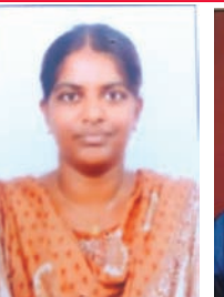
మీసాల యామిని 5వ ర్యాంక్