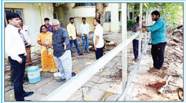
త్వరితగతిన పనులను పూర్తి చేయండి