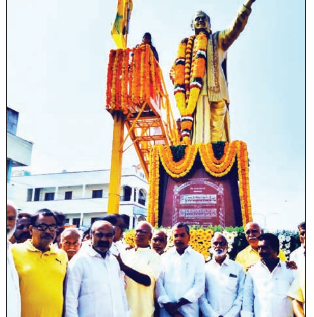
పార్టీ కుటుంబ సభ్యులు అందరూ సభ్యత్వ నమోదు కార్యక్రమంలో చురుగ్గా పాల్గొనాలి. తెలుగుదేశం పార్టీ కుటుంబ సభ్యులంతా ఈ అవకాశాన్ని సద్వినియోగం చేసుకోవలసిందిగా విజ్ఞప్తి.